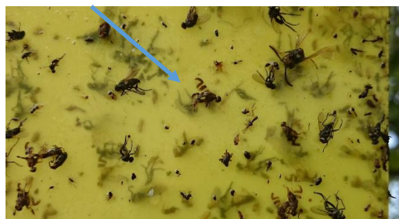
Obrázok 4 Vrtivka orechová

Na sledovanie výletu múch, ale aj odchyt múch je možné použiť žlté lepové doštičky , ktoré treba zavesiť koncom júna až začiatkom júla do korún stromov z južnej strany. Priama ochrana je zameraná na likvidáciu dospelých jedincov, najmä samičiek, a to ešte pre tým ako nakladú vajíčka. Prvá aplikácia sa vykonáva 7 až 10 dní po chytení prvých imág na žlté lepové doštičky. Postrek treba opakovať každých 7 až 10 dní až do konca augusta. Na Slovensku nie je zatiaľ registrovaný žiaden prípravok. V Európe sa používajú prípravky zaregistrované proti vrtivke čerešňovej. Záhradníci v Európe používajú postreky pozostávajúce z kombinácie lákadla ( Combi-protect ) a štandardných insekticídov. Z biologických insekticídov sa používa prípravok na baze spinosadu ( Spintor ). Nepostrekuje sa celý strom, ale len jedna časť, najlepšie stredná časť koruny.