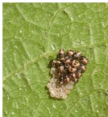
Obrázok 10 Vajíčka a vyliahnuté larvy

Dospelá bzdocha prezimuje pod kôrou stromov, opadaným lístím, tiež v bytoch alebo iných budovách. Na jar úkryt opúšťa a začína prijímať potravu. Krátko po úživnom žere dochádza k páreniu a samičky kladú vajíčka na hornú stranu listu. Vyliahnuté larvy neprijímajú potravu, nerozliezajú sa, ale zostávajú v skupinách, čo im umožňuje spoločne sa chrániť pred predátormi vylučovaním chemických látok.