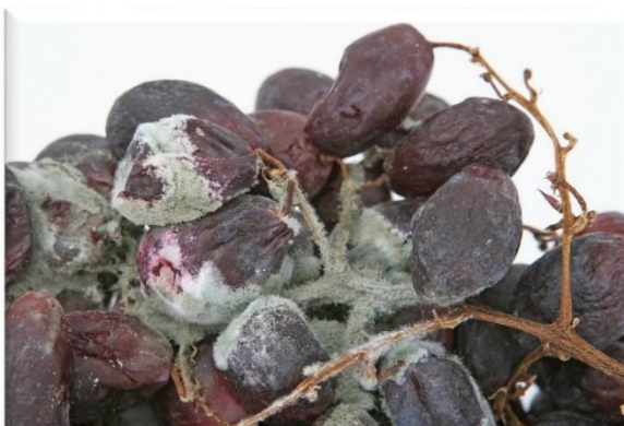
Obrázok 11 Pleseň sivá na viniči

Proti plesni sivej využívame mnohé pestovateľské (agrotechnické) opatrenia ktoré eliminujú vhodné podmienky na vývoj patogéna ako sú prevzdušnenie porastu, zelené práce – odstraňovanie listov v zóne strapcov. Tiež treba zabrániť poškodeniu hrozna predovšetkým druhou generáciou obaľovačov. Priamu ochranu robíme väčšinou pred uzavretím strapcov a na