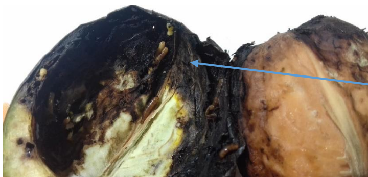
Obrázok 1 Orech poškodený vrtivkou orechovou

Vrtivka orechová, Ragoletis completa , je malá muška. Telo má dlhé 4-6 mm. Prezimuje v štádiu kukly v pôde pod stromami. Dospelé jedince vyletujú začiatkom júla. Vyskytujú sa až do konca septembra s najpočetnejším výskytom v júli a auguste. Po 8 dňoch od výletu sa muchy začínajú páriť. Samičky kladú vajíčka pod povrch zeleného oplodia orechov. O 5 dní sa z vajíčok liahnu larvy, ktoré sa živia sa v oplodí 3 až 5 týždňov. Larvy nedokážu preniknúť cez škrupinu a tak jadro vo vnútri zostáva nepoškodené (na rozdiel od bakteriôz, kde jadro černie). Dorastená larva opúšťa oplodie a zakuklí sa v pôde v hĺbke 10 – 15 cm, kde aj prezimuje. Škodí larvy vyžieraním oplodia. Následkom poškodení dochádza k sekundárnym infekciám baktériami a kvasinkami, ktoré vytvárajú najprv hnedé, neskôr čierne škvrny, ktoré splývajú a pokrývajú celý plod. Hniloba preniká aj k semenu. V prípade skorého napadnutia sú plody scvrknuté, mäkké a predčasne opadávajú.