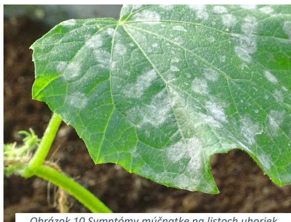
Obrázok 10 Symptómy múčnatke na listoch uhoriek

Múčnatka je po plesni uhorkovej najvýznamnejšou chorobou uhoriek. Pôvodcom tejto choroby môžu byť dva druhy húb - Erysiphe cichoracearum a Podosphaera fusca . V druhej polovici vegetácie vznikajú na všetkých nadzemných častiach a najmä na listoch biele múčnaté škvrny, ktoré sa postupne zväčšujú a vytvárajú súvislý biely povlak. Na bielych mycéliových povlakoch sa niekedy vytvárajú hnedočierne vreckaté plodnice – kleistotécia. Napadnuté listy nerastú, sú zakrpatené, žltnú a uschýňajú. Plody z napadnutých rastlín sú zdeformované a nedosahujú trhovú kvalitu. Silne napadnuté rastliny hynú. Optimálne podmienky pre výskyt a šírenie choroby sú vyššie teploty (nad 22°C) a nízka, alebo kolísavá vlhkosť vzduchu. Tiež chorobe vyhovujú husté porasty a nevyvážené hnojenie (nadbytok dusíka). Okrem rastlín z čeľade tekvicovitých napáda aj rastliny z čeľade Asteraceae a Solanaceae . Je to významné ochorenie najmä náchylných skleníkových uhoriek a v niektorých rokoch aj na poľných.