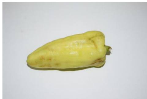
Obrázok 5 Plod paprike poškodení strapkami

Strapka tabaková - Thrips tabaci je najčastejšie sa vyskytujúca strapka v skleníkoch, ale aj najškodlivejší druh na otvorenom poli. Vyhovuje jej teplá kontinentálna klíma. Je výrazný polyfág škodiaci na zelenine, napáda cibuľu, pór, kapustu, uhorky, rajčiny a šalát. V poľných podmienkach prezimuje imágo (dospelec) vo vrchných vrstvách pôdy na pozberových