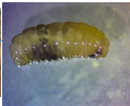
Obrázok 2 Larva vrtivky orechovej