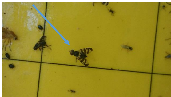
Obrázok 3 Vrtivka čerešňová

Na jar sa ešte odporúča postrek pôdy pod stromom prípravkami na baze entomopatogénnych hub, ktoré ničia kukly škodcu v pôde. U nás je zatiaľ registrovaný prípravok na baze huby Beauveria bassiana ( Bora ). Tohto roku na trhu sú aj ďalšie prípravky na baze baktérii ( Effetto ). Tieto prípravky sa môžu aplikovať aj na jeseň proti larvám a kukulám, ktoré sú v pôde.