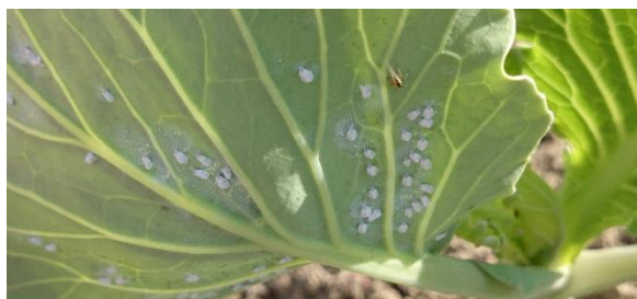
Obrázok 8 Imága molice na kapuste

Škodí larvy, nymfy a dospelé jedince vyciavanim štiav z pletív rastlín, predovšetkým zo spodnej strany listov. Následkom vyciavania štiav prichádza k zmenám farby rastliny. Na začiatku sa na listoch objavujú žlté škvrny. Ich počet rýchlo rastie, takže listy celé žltnú. Napadnuté listy sa deformujú a opadávajú. Molica lastovičníková škodí aj vylučovaním medovice (produkt metabolizmu obsahujúci cukry), ktorá pokrýva listy. Na týchto častiach sa vyvíjajú huby, černe, čo spôsobuje zníženie fotosyntézy. Okrem toho napadnuté rastliny sú