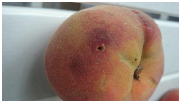
Obrázok 7 Plod poškodený larvou obaľovača

z náletu motýľov do feromónových lapačov v okolí Nitry a signalizačných správ UKSUPu, aplikáciu biologickými prípravkami proti obaľovačovi broskyňovému tohto roku bude treba vykonať koncom prvej dekády júla a proti obaľovačovi slivkovému v polovici júla .