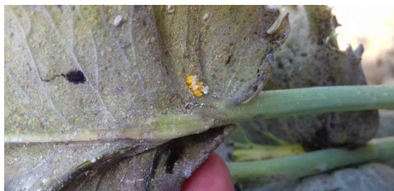
Obrázok 9 Liahnutie molíc z vajčiek

*Pri podržaní tlačidla CTRL na klávesnici + kliknutím myšou na podčiarknuté do modra sfarbené názvy prípravkov sa dostanete na našu stránku, kde sa dozviete podrobnejšie informácie ohľadom daných prípravkov.