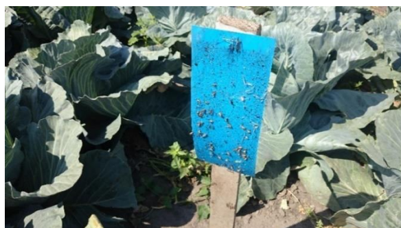
Obrázok 6 Modrá lepová doska v poraste kapusty

Zníženie populácie tejto strapky môžeme dosiahnuť dodržiavaním osevného postupu, ničením pozberových zvyškov, pravidelným obrábaním pôdy a pravidelným a dôsledným ničením burín. Dážď a zavlažovanie postrekom výrazne znižujú populácie strapiek ich zmývaním z povrchu rastlín. Červené odrody cibule sú spravidla citlivejšie na strapky ako biele a žlté odrody. Sejbou medziplodiny (ďateľina) do