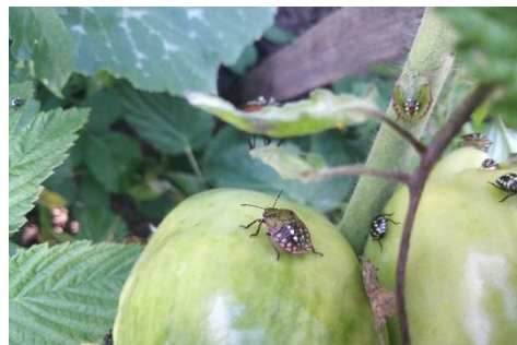
Obrázok 11 Rôzne instary larvy bzdochy zeleninovej

Škody spôsobuje vyciavanim štiav zo všetkých nadzemných orgánov rastlín, ale najviac preferuje mladé plody v čase dozrievania a výhonky. Poškodené plody majú na povrchu bledé škvrny, ktoré časom hnednú až černejú. Kvalita plodov klesá, deformujú sa a opadávajú. Okrem toho zapáchajú. Druhotne sa na nich môžu vyskytnúť infekcie, ktoré bzdochy prenášajú.